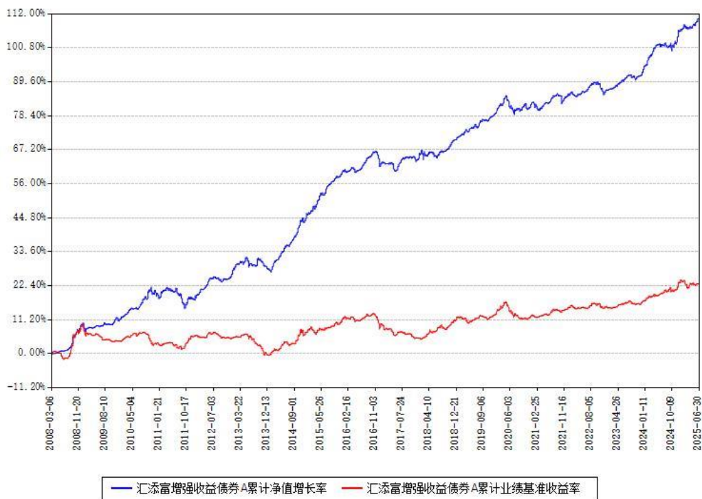
汇添富增强收益债券A累计净值增长率与同期业绩比较基准收益率对比图